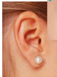
Muskelaktivität sehen und hören